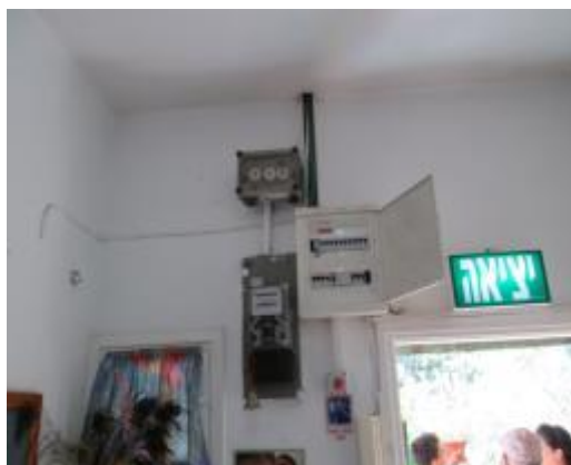
תמונה 2 : אולם הגן